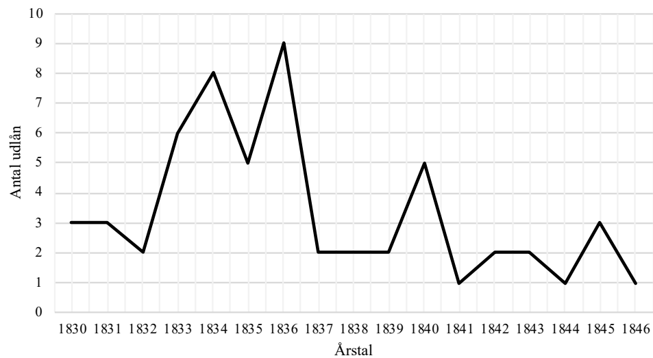
FIGUR 2: KB's udlån af Schleiermacher i perioden 1830-1846

Som figuren viser, har der i hele den undersøgte periode været udlån af Schleiermachers værker, men disse udlån har over årene været af et varierende antal. Bemærkelsesværdigt er det at iagttage den stigning i antallet af udlån, som finder sted ved Schleiermachers just beskrevne besøg i eftersommeren 1833. Således finder alle udlån af hans værker dette år sted i perioden fra 18. oktober til 3. december, hvorfor det må antages, at besøget har interesseret andre end den sangskrivende Monrad.